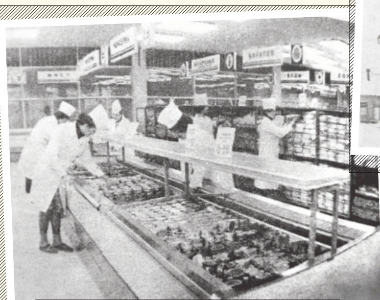
1981 год. Универсам на стыке двух улиц – Комарова и Гурьянова – открывает двери.