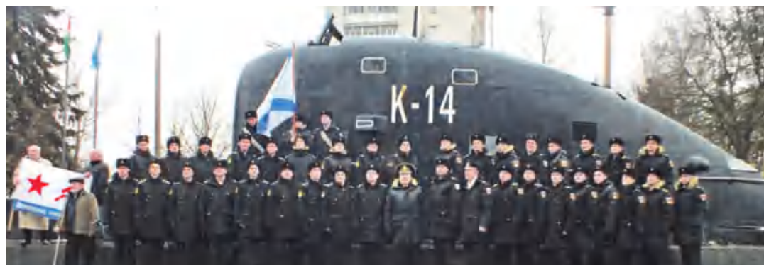
19 марта 2017 г. – День подводника с экипажем подводной лодки.

В 1958 году на плечи Фалеева легли пого-