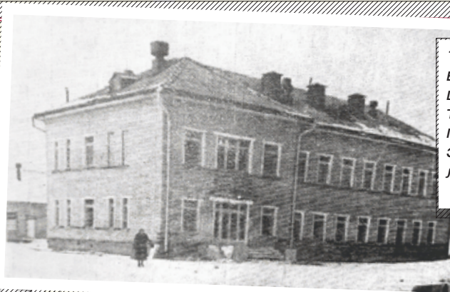
1962 год. Это новое здание недавно первым вступило в эксплуатацию в строящемся больничном городке на 24 квартале. Здесь в специально оборудованных помещениях разместились санитарно-эпидемиологическая станция и бактериологическая лаборатория.