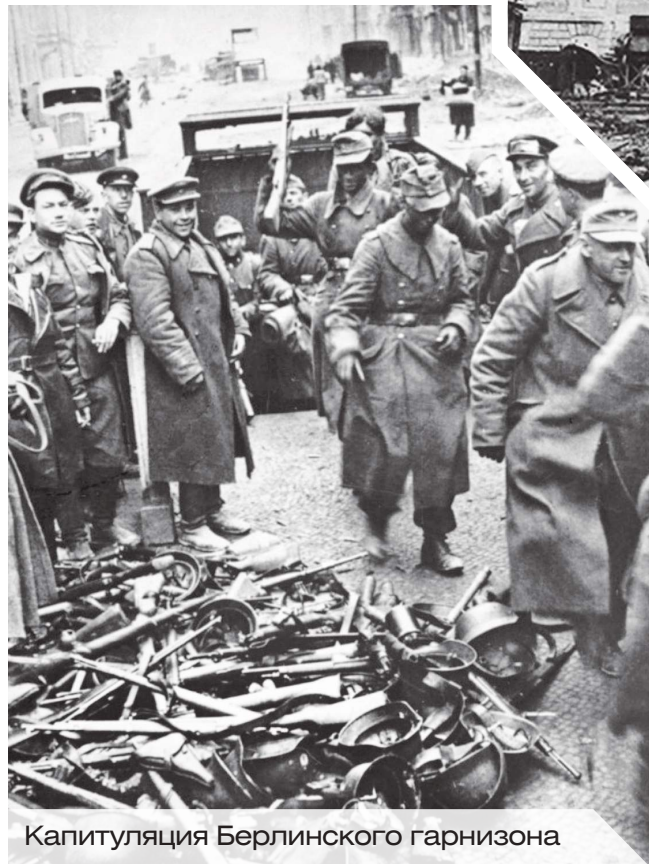
Капитуляция Берлинского гарнизона

Здесь подразделения 1-й танковой встречали новейшие немецкие танки «Королевские Тигры». Из оконных проёмов разрушенных зданий «панцерфаустники» (гранатометчики) расстреливали танки фаустпатронами. Мотострелки, прижимаясь к стенам домов, пытались укрыться от пулемётного перекрёстного огня из оконных проёмов высотных зданий. Город, разрушенный бомбардировками, представлял собой бастион безнадёжной и