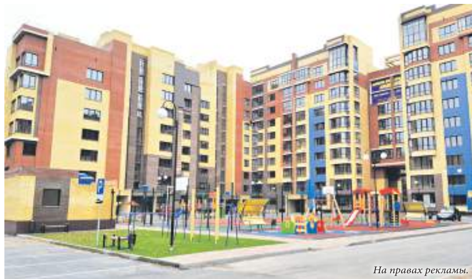
На правах рекламы.

МИРОНОВ: Думаю, да. Строить дома смогут те компании, у которых есть возможность возвращать кредит банкам, ведь доступ к деньгам покупателей для них будет закрыт. К тому же, чтобы получить разрешение на строительство, у девелопера должно быть на счёте не меньше 10% средств от планируемой